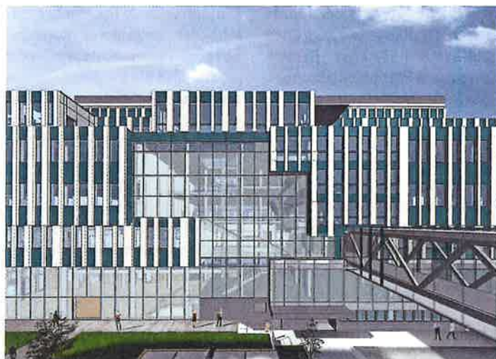
Ansicht eines mit BIM geplanten Forschungsgebäudes (Forschungsinstitut für Molekulare Pathologie [IMP], Boehringer Ingelheim Austria, Wien) in der allgemeinen Ansicht ...