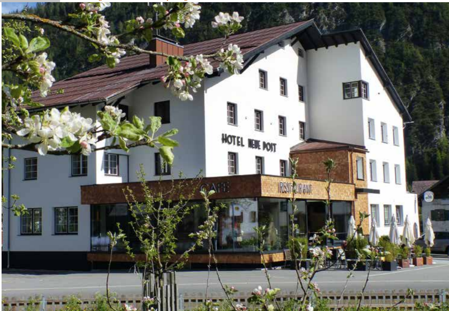
Vielseitigkeit ist die Stärke der Neuen Post in Holzgau – das Angebot richtet sich an Familien, sportlich Aktive und Genießer.