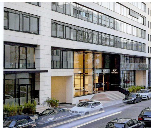
Durch eine hochwertige Sanierung des gesamten Bürogebäudes soll eine dazu passende Mieterschaft angesprochen werden.