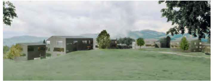
01+02 Gebiet Bül - Unterstadel (Dietrich / Untertrifaller / Stäheli): Die Häusergruppen am Hang schaffen halböffentliche Räume